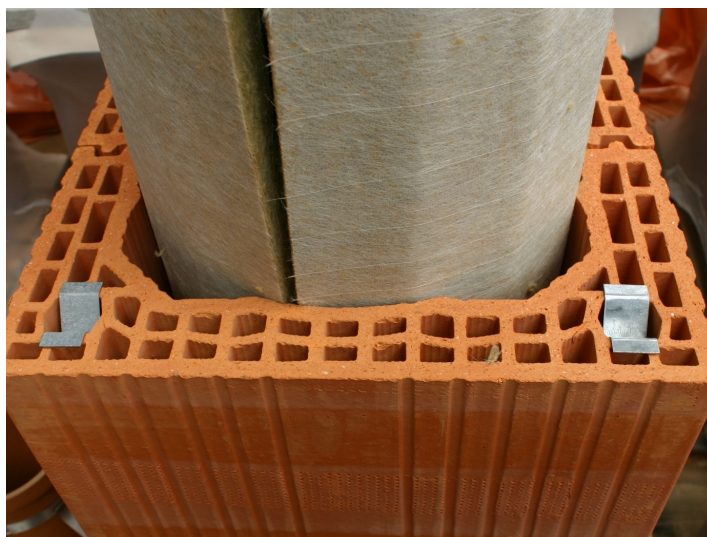
Umístění zaslepujících plíšků

Pokud se nadstřešní část staví z prstenců GRAND , výztuž se použije vždy , bez ohledu výšky. I zde platí pravidlo výška nadstřešní části x 2 .